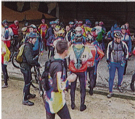
27 novembre dans l'enfer vert !